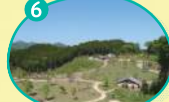
6 森の広場 見晴らしベンチからの眺め

公園内に50mごとにアルファベット(AまたはB)と数字の入った看板が建てています。何か困った時や場所を知らせたい時は看板に書いてあるアルファベットと数字をお知らせください。 丹波並木道中央公園 管理事務所 TEL.079-594-0990 (9:00~17:00)