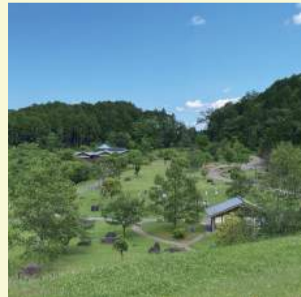
兵庫県立丹波並木道中央公園 TANBA Namikimichi Central Park

公園は丹波篠山市の味間(あじま)地区、大山地区にまたがったエリアにあり、東西に長い公園です。公園面積は70.9ヘクタール(甲子園球場約18個分)あり、そのうちの約6割がスギ・ヒノキを中心とした森林です。公園は三釈迦山(標高318m)の斜面を利用して作られており、園内にある登山道から三釈迦山の頂上に登っていただけます。頂上の展望台からは篠山盆地を一望していただけます。また公園には製材所があり、公園内で間伐をし、製材をした木材を木工教室などの体験型プログラムや園内にあるベンチや木製のおもちゃなどに使っています。