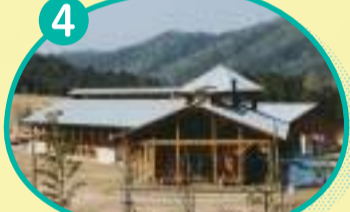
4 森林活動センター