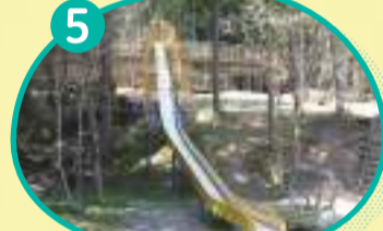
5 ローラーすべり台