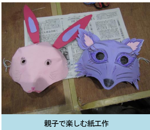
親子で楽しむ紙工作