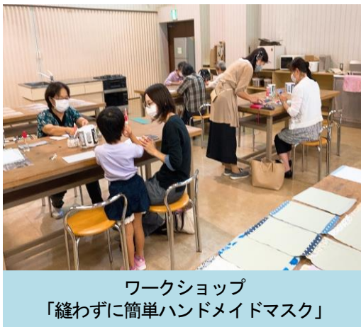
ワークショップ 「縫わずに簡単ハンドメイドマスク」