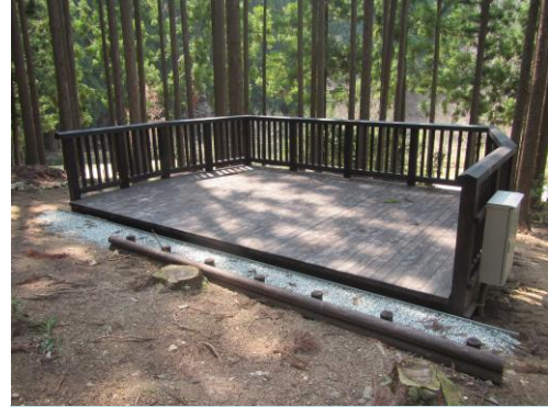
ささもりのステージ