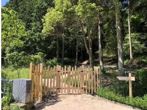
丹波の森公園散策道（西入口）

また、ささやまの森公園においては、老朽化が目立ち使えなくなっていたステージを一新しました。ステージの床面積は3倍ほどになり、使い勝手の良いものになったことで今後の活用が期待されます。