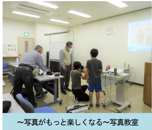
～写真がもっと楽しくなる～写真教室