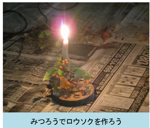
みつろうでろうソクを作ろう