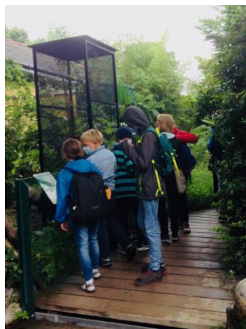
国立シェーンブルン動物園

丹波地域の貴重な財産である里山。その里山のシンボルともいえる国蝶オオムラサキが丹波地域とウィーンの交流の懸け橋となっています。