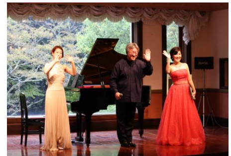
トライアルライブⅠ