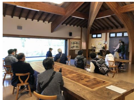
現地学習（兵庫県立コウノトリの郷公園）