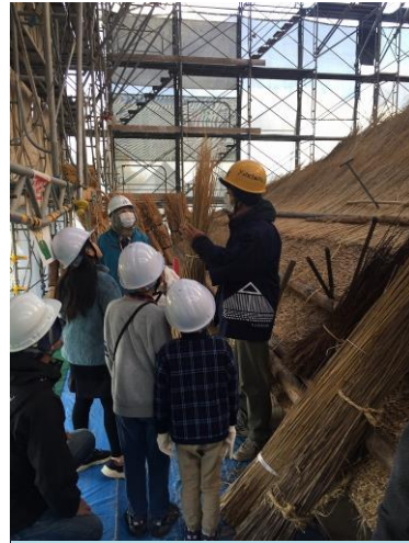
茅葺職人によるガイド