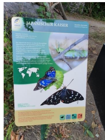
オオムラサキの説明