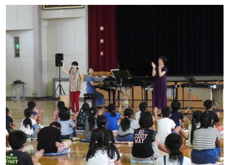
ふるさと音楽ひろば