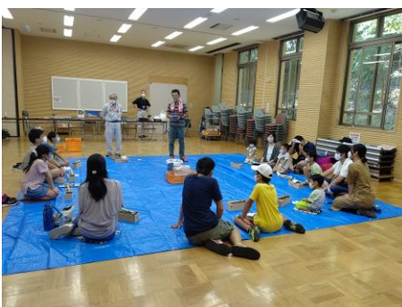
丹波地域恐竜化石フィールドミュージアム等を説明