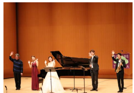
トライアルライブⅡ