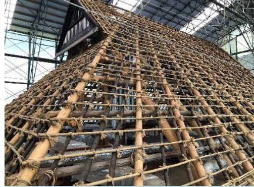
古い茅が取り外され、骨組みだけになった屋根