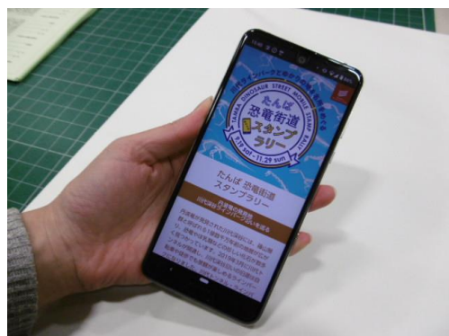
モバイルスタンプラリー画面