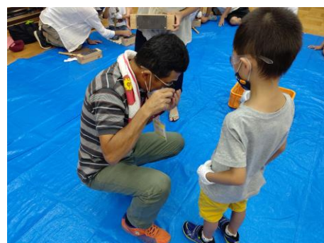
化石専門指導員による指導