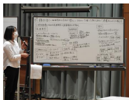
発言された意見の振り返り