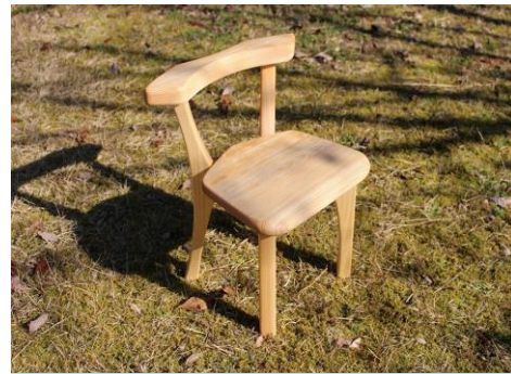
特別に製作された オリジナルデザインの木製椅子