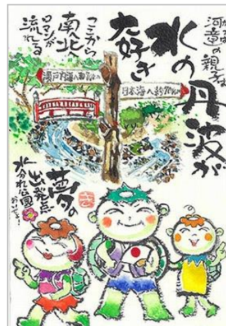
オーディエンス賞作品