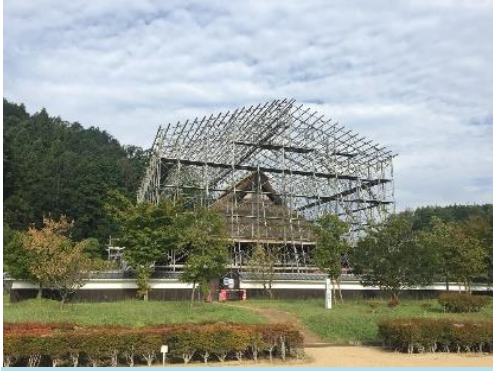
葺替え工事のために組まれた足場