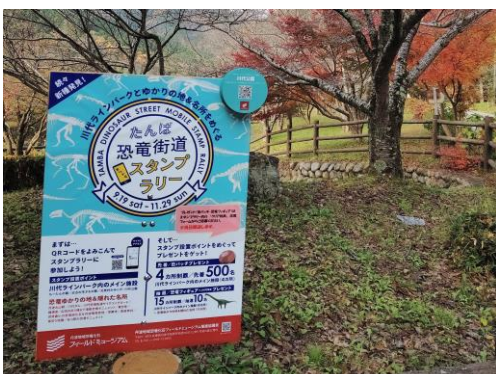
スタンプラリースポット （主要4ヶ所／隠れた名所等11ヶ所）