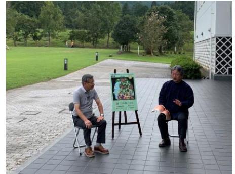
思い出の街角コンサート対談収録

10地区の街角コンサート実行委員長と畑儀文音楽監督の対談を通して、25年にわたるコンサートを振り返り、音楽祭の楽しみ方を提案しました。動画投稿サイトYouTubeで配信しました。