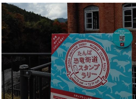
スタンプラリースポット （恐竜化石・世界最小の恐竜卵化石発見地）