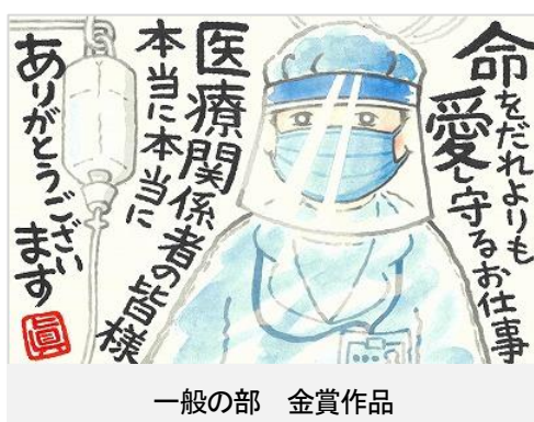
一般の部 金賞作品

(その後、兵庫県勤労福祉協会（神戸市）、丹波ゆめタウン、丹波篠山市中央図書館、丹波の森公園にて巡回展示)