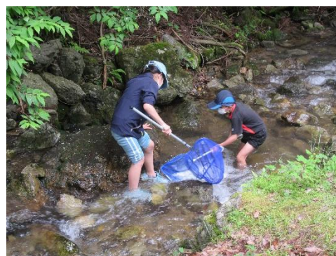
水辺の生きもの探し