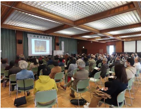
第6回講義（公開講座）