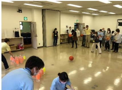
看護学生との交流（10月6日）