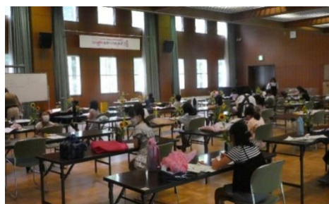
夏休み子ども池坊いけばな教室