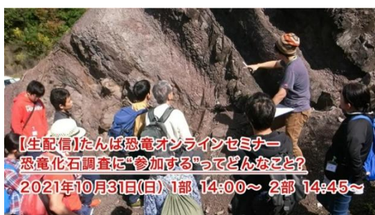
丹波篠山市太古の生きもの館からYouTubeで生配信