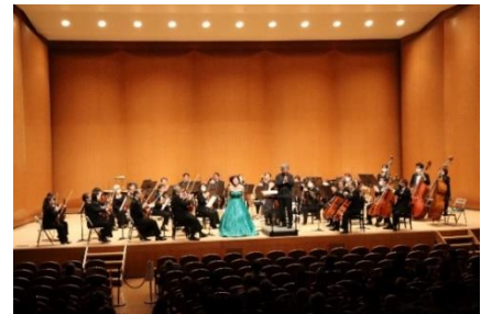
ガラ・コンサート