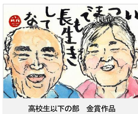
高校生以下の部 金賞作品