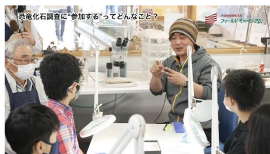
化石保護技術員から剖出作業の説明