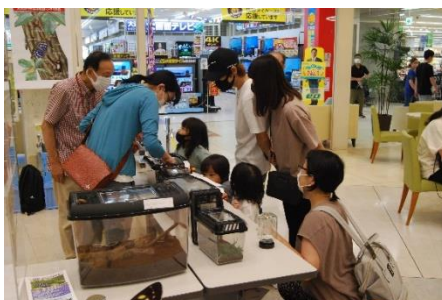
生きものを見る家族連れ

オオムラサキ、カブトムシ、ミヤマクワガタ、ヒラタクワガタ、ノコギリクワガタ、コクワガタ、カナブン、アオカナブン、クロカナブン、シロテンハナムグリ、アオドウガネ、ナナフシモドキ、オオセンチコガネ、タマムシ、オオゾウムシ、ヨツボシオオキスイ、ヤブキリ、ホトケドジョウ、ナガレホトケドジョウ、アカハライモリ、イシガメ、サワガニ、カワニナ