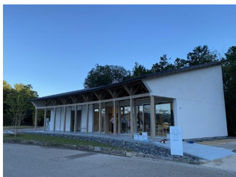
サイクルステーション外観