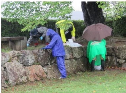
地域実践の日（7月7日）

今年度の兵庫県地域高齢者大学「丹波OB大学・丹波OB大学大学院」は、4月21日（水）に開講しました。丹波OB大学101人、丹波OB大学大学院20人の受講生らが、学習や交流を通じた生きがいがづくり、地域活動の実践等に元気に取り組んでいます。