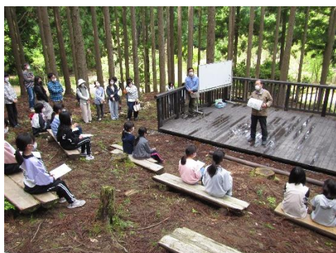
森のステージで入校式