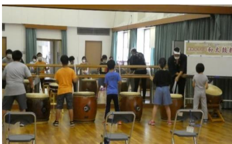
夏休み子ども和太鼓教室