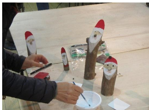
森のサンタを作ろう