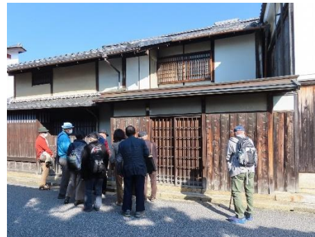
現地学習（滋賀県近江八幡市）