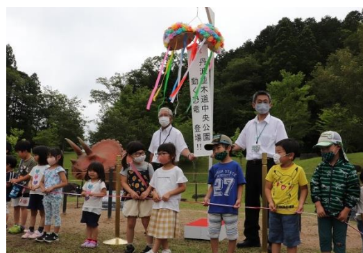
オープニング式典