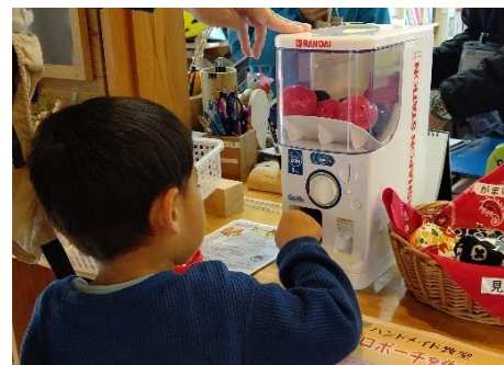
景品交換（スタンプ2個でガチャ1回）