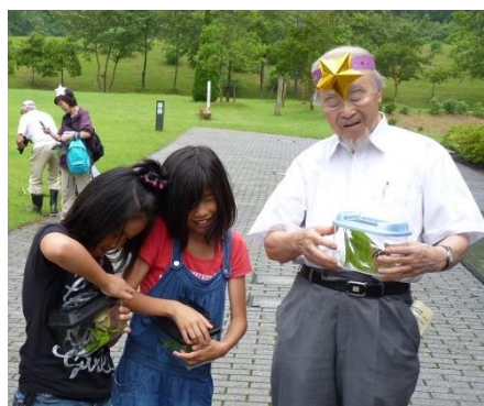
国蝶オオムラサキ放蝶会にて

私たちは、河合雅雄先生のご遺志をしっかりと受け継ぎ、より豊かな丹波の森づくり、ひとづくりにいっそう励みます。