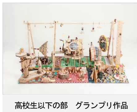
高校生以下の部 グランプリ作品