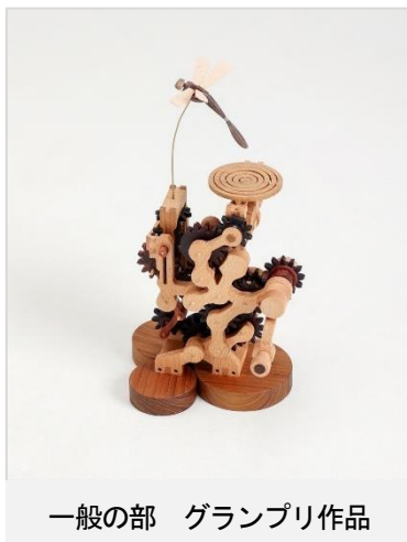
一般の部 グランプリ作品