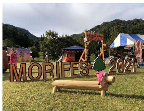
ハロウィンビレッジ