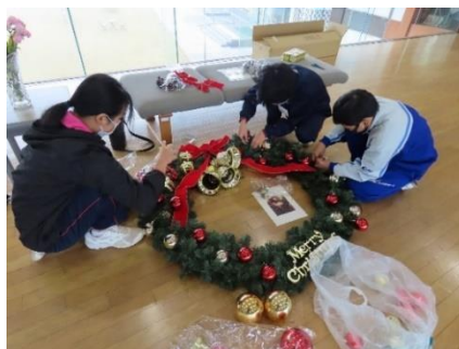
ロビーのクリスマス装飾