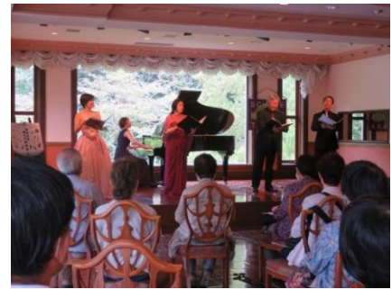
オープニング・サロンコンサート