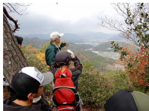
散策道からの眺望