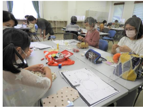
ハンドメイド教室 「がま口ポーチを作ろう！」