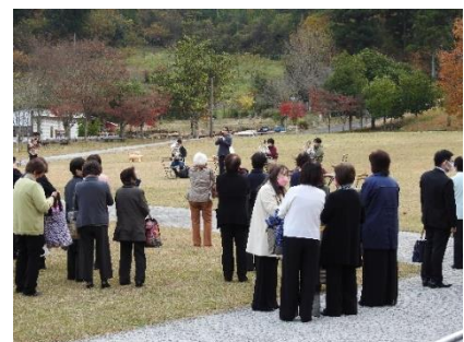
フラッシュ・モブ

丹波合唱祭（11月21日（日））開催後、丹波の森公苑の中庭にてフラッシュ・モブを実施しました。