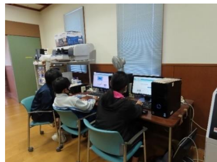
パソコンを使ったポスターづくり