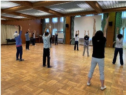
夏の健康気功体験教室

丹波の森公苑では、生活創造活動グループが行うイベントを支援しています。新型コロナウイルス感染症拡大防止対策をとりながら、ナチュラルリースづくり、気功体験教室、がま口ポーチづくりなど8件の多彩なイベントが開催され、幅広い年代の参加者で賑わいました。