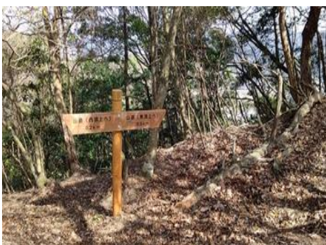
リニューアルした道標