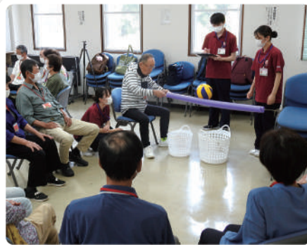
看護学生との交流会